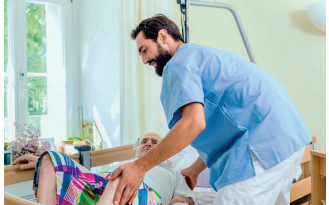
Arbeiten in der Pflege ist mit körperlicher Belastung gerade im Rückenbereich verbunden. Um Schmerzen oder Folgeschäden zu vermeiden, empfiehlt es sich, mit geeigneten Maßnahmen vorzubeugen.

Teilnehmer. Außer der Bandage erhielten sie ein Aktivitätstagebuch zur anonymen Dokumentation über sechs Wochen. Pro Woche sollten sie einen Fragebogen zu Arbeitsbelastung, Gesundheitszustand und Erfahrungen mit der Bandage ausfüllen.